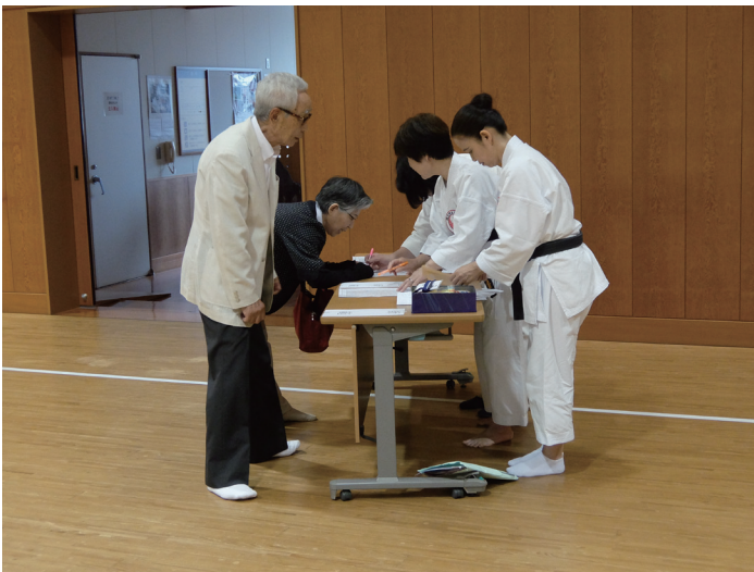
受付での出席者の確認

総会開始前に、先日の熊本県支部設立30周年記念大会及び九州ブロック大会の様子を伝える写真がスライドショーでスクリーンに映し出されました。定刻になると総会が始まり、議事運営もスムーズに進行しました。