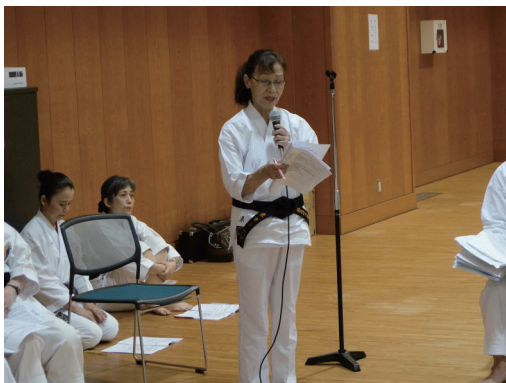
東豊子事務局長より事業計画案の提案