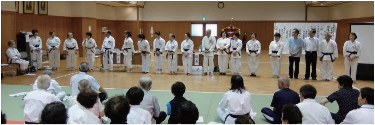
平成27年度熊本県支部役員紹介