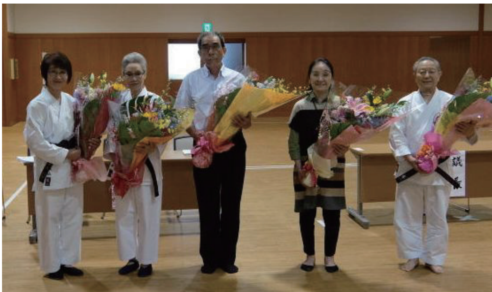
退任される支部役員の方々。長い間本当にお疲れ様でした。