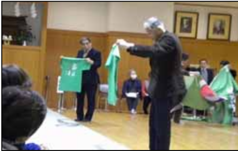
25周年を記念してのTシャツ